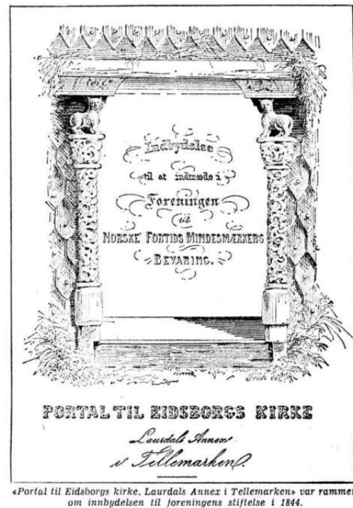
Portal til Eidsborgs kirke, Laurdals Annex i Telemarken var rammen om innbydelser til foreningens stiftelse i 1844.

Hvem vil sette all sin glede og all sin evne inn på å skape varige verdier, når ingen skal vare? Kan vi vente at kommende generasjoner skal respektere vårt livssyn, om vi selv har sløttet ut fedres spor?