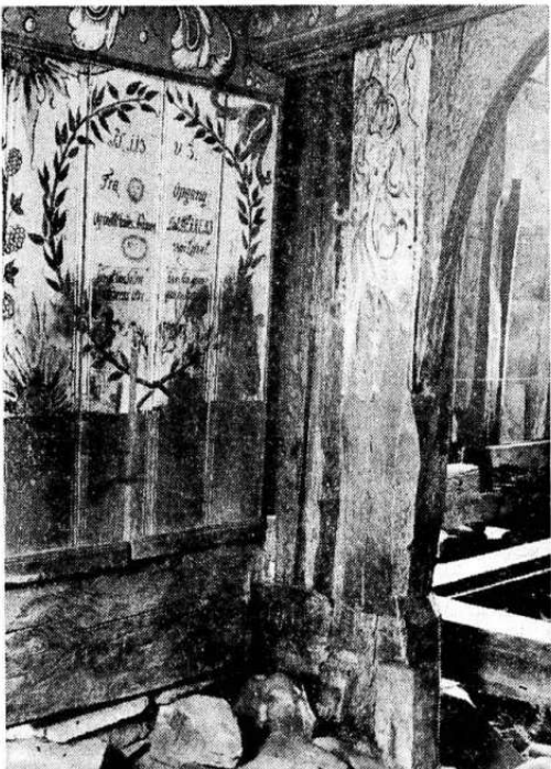
Bygningsarkeologiske undersøkelser de siste som viser at Nore stavkirke i Numedal — i foreningens eie siden 1890 — ble oppført som korskirke. Etter en utvidelse omkring 1710 ble de nybygde fløyer dekorert bl. a. med skriftsteder malt i rebusform, som dette bilde fra den nordre vingen viser. Stolpen som markerer åpningen inn mot skipt viser spor etter den opprinnelige veggen.

Ingen fare. Kom imorgen. 125-Åringens levetidsløp skal bli oss fortalt.