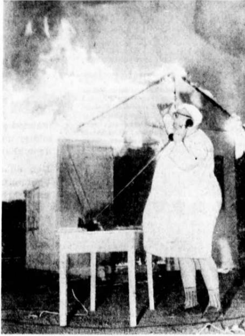
Et av glansnumrene i går var «Brann hos Pettersen» hvor Einar Rose spilte hovedrollen. Her ser man ham da han ringer brannvesenet for å varsle brannen, som jo hadde fått et meget godt tak i huset hans da han endelig hadde gjort det forståelig hvor brannen var.

Når Oslo Brannvesen holder sin årlige «Brannmannsdag» kan korpset være sikker på å samle fullt hus. Oslo Brannvesen regnes for å være blant de aller beste som finnes og det er ved en rekke anledninger gitt uttrykk for at det står fullt på høyde med tilsvarende korpse i de store byer utover i verden. Korpset har da også efter hvert skaffet seg materiell og annet førsteklasses utstyr, som anvendes med stor kyndighet ved utrykninger.