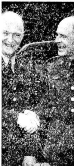
General Ridgway (til høyre) fotografert da han kom til Paris i mai i fjor for å avløse Eisenhower som øverste sjef for NATO.