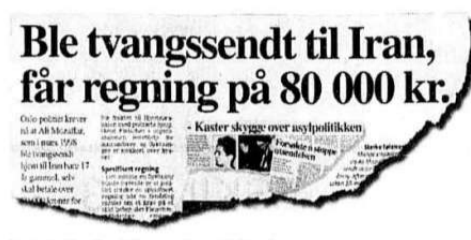
Faksimile fra Aftenposten sist fredag.

Kommunalminister Sylvia Brustad (a) visste ikke at Norge var alene om å la asylsøkere som blir kastet ut av landet, betale for politiskortet. Nå vurderer hun å endre reglene.