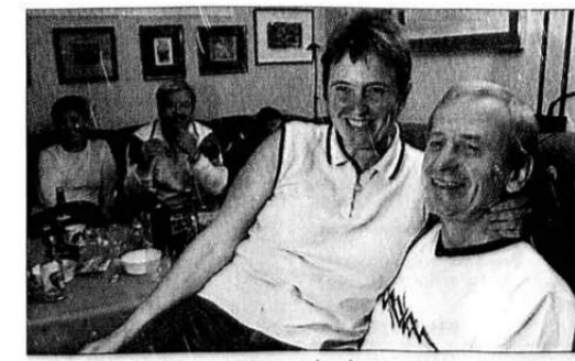
Mangemillionær. Gunnar Hagenlund sammen med samboeren Grete Stærkebye.