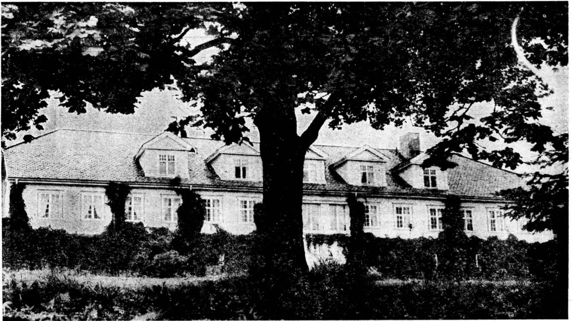
Grefsheim sett fra havsiden.