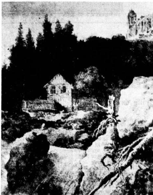
Er det Fresjeborgen eller et huskapell man ser på dette utsnitt av den nederlandske maler A. van Everdingens landskap med foss fra ca. 1660? Maleriet kan være laget etter en tegning fra Larvik-distriktet i 1640-årene, da kunstneren var i Norge.