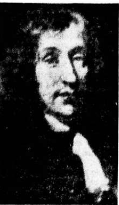
Ulrik Frederik Gyldenløve, den første greve av Laurvig.

Sagbrukene ble en av de vesentligste forutsetninger i den våknende norske samfunnsdannelse fra slutten av 1500-tallet. Godsdannelsen kan vi studere i